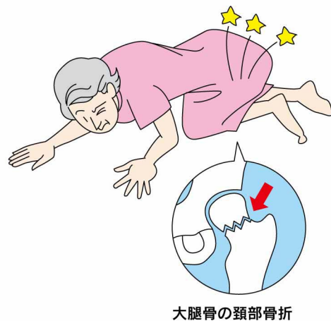
大腿骨の頸部骨折

加齢に伴う膝を伸ばす筋力の低下 (福永哲夫, トレーニング科学, Vol.17, No.4, P289, 2005)